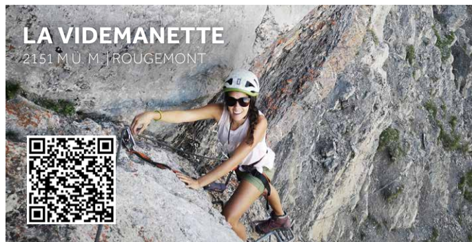
LA VIDEMANETTE 2151 M.U.M. | TROUGEMONT

AHV-TAGE Siehe Events | Voir événements | Check events