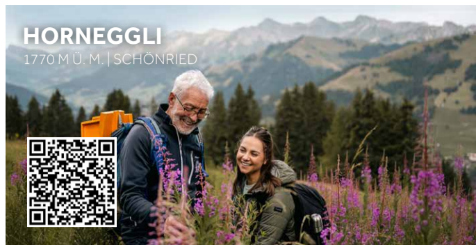
HORNEGGLI 1770 M.U.M. | SCHÖNRIED

AHV-TAGE Siehe Events | Voir événements | Check events