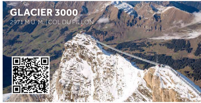
GLACIER 3000 2971 M.U.M. | COL DU PILLON