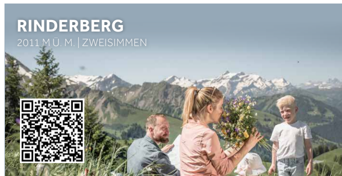
RINDERBERG 2011 M.U.M. | ZWEISMÜNEN