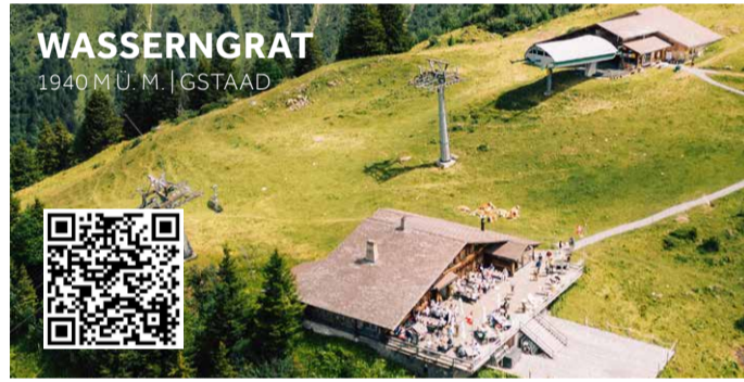
WASSERNGRAT 1940 M.U.M. | GSTAAD