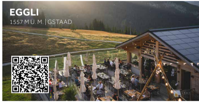
EGGLI 1557 M.U.M. | GSTAAD