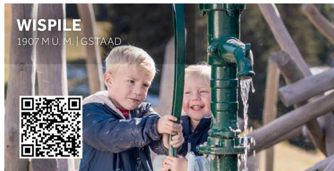
WISPILE 1907 M.U.M. | GSTAAD

AHV-TAGE Siehe Events | Voir événements | Check events